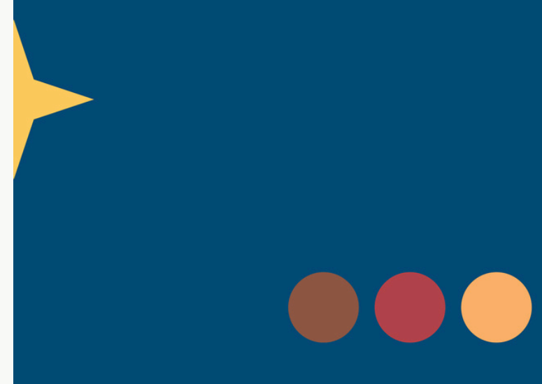
„STERNDEUTER“, AUS DEM BUCH „DIE BIBEL IN FORMEN UND FARBEN“ © CORNELIA STEINFELD