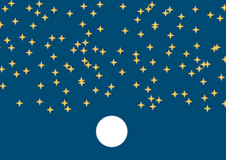
„VERHEISSUNG“, AUS DEM BUCH „DIE BIBEL IN FORMEN UND FARBEN“ © CORNELIA STEINFELD